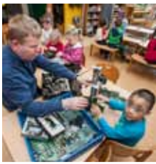
Leikskólinn Laugasól bls. 2