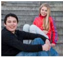
Vallaskóli bls. 4