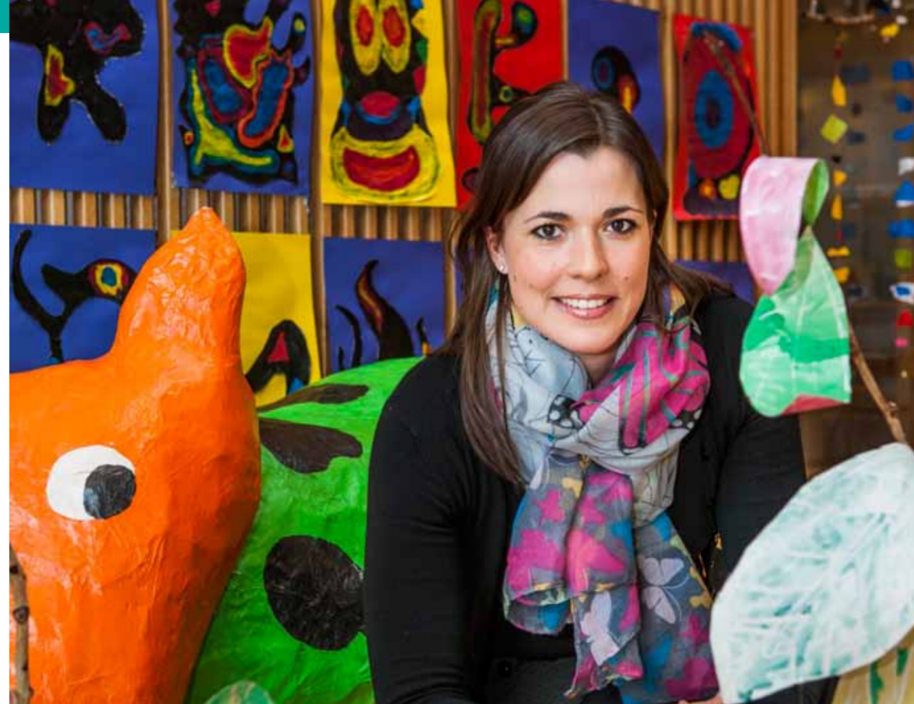
Hrafnhildur Sigurðardóttir: „Í þeim er kennarinn ekki með fyrirfram ákveðna hugmynd um hvernig hlutirnir eiga að vera.“