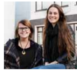
Tækniskólinn bls. 6