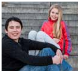
Vallaskóli bls. 4