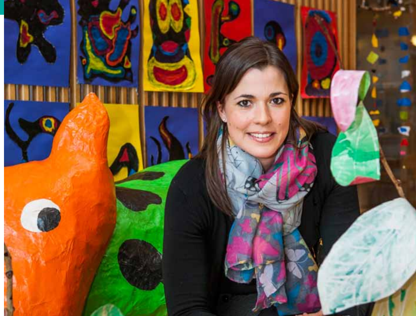
Hrafnhildur Sigurðardóttir: „Í þeim er kennarinn ekki með fyrirfram ákveðna hugmynd um hvernig hlutirnir eiga að vera.“