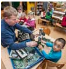
Leikskólinn Laugasól bls. 2