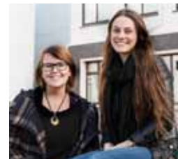
Tækniskólinn bls. 6